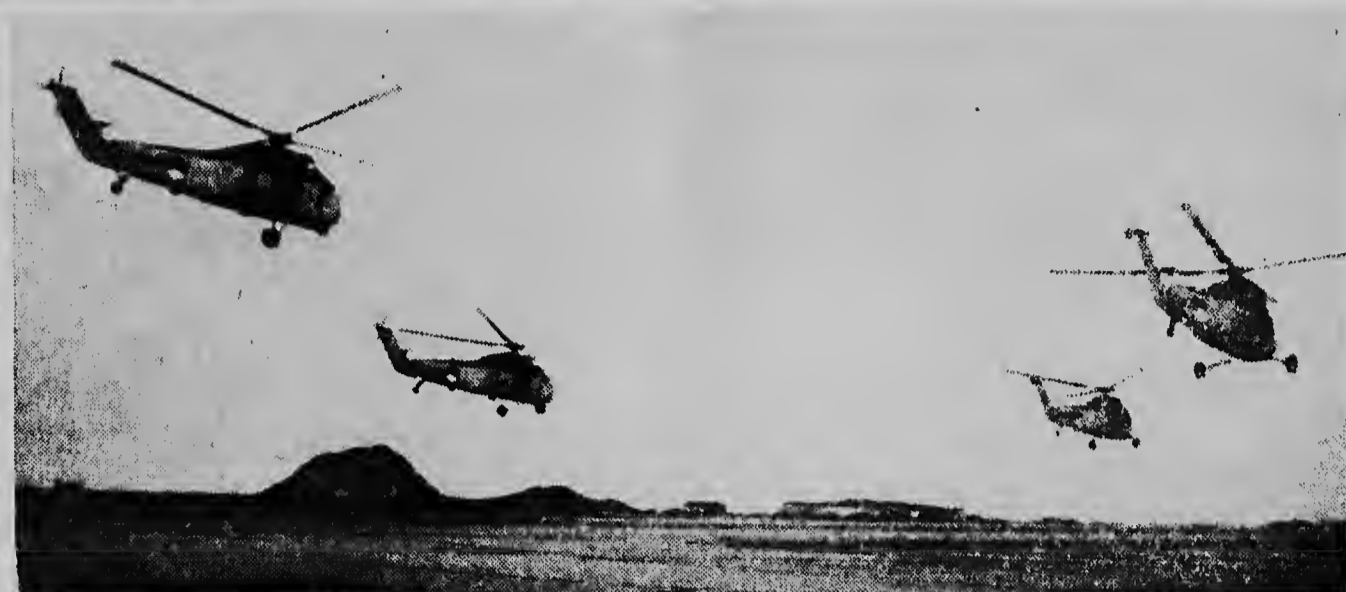
Aqui nos ta mira e squadron na cumintamento dje demonstracion asina exitosa ta bula pasa sigui pa bistanan asombra di centenares di espectadornan.